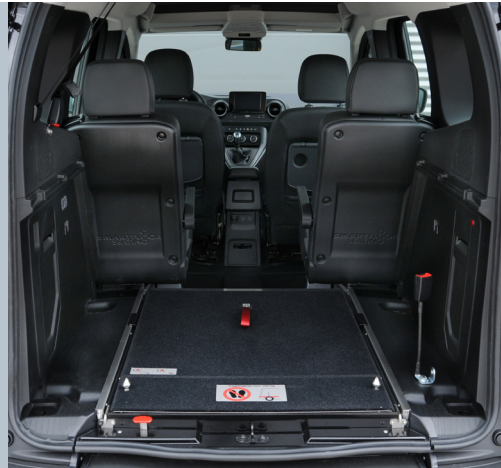
Die eingeklappte EASYFLEX Rampe ermöglicht die volle Nutzung des Kofferraums.