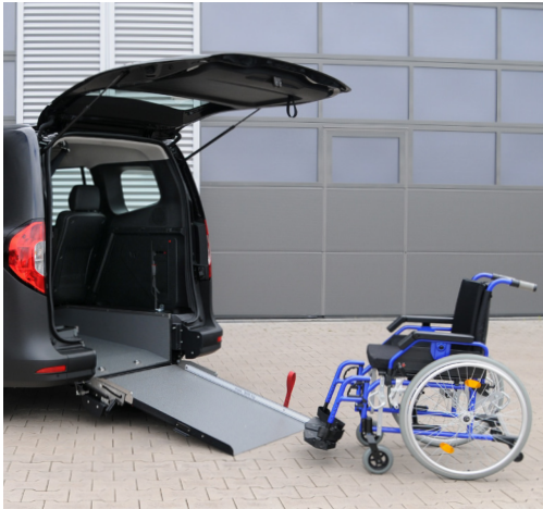
Bei ausgeklappter Rampe lässt sich das Fahrzeug bequem mit dem Rollstuhl befahren.