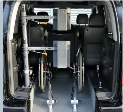
Das Fahrzeug kann mit der Kopf- und Rückenstütze FUTURESAFE ausgestattet werden.